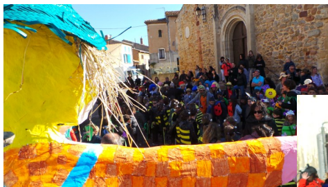
Les rues animées